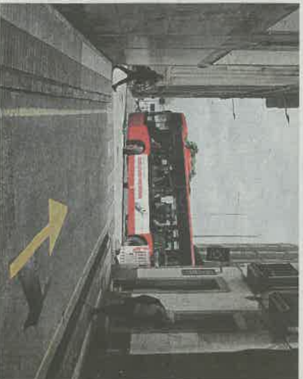
Giro milimétrico. Desde Cordelería, los buses deben ajustar la maniobra.